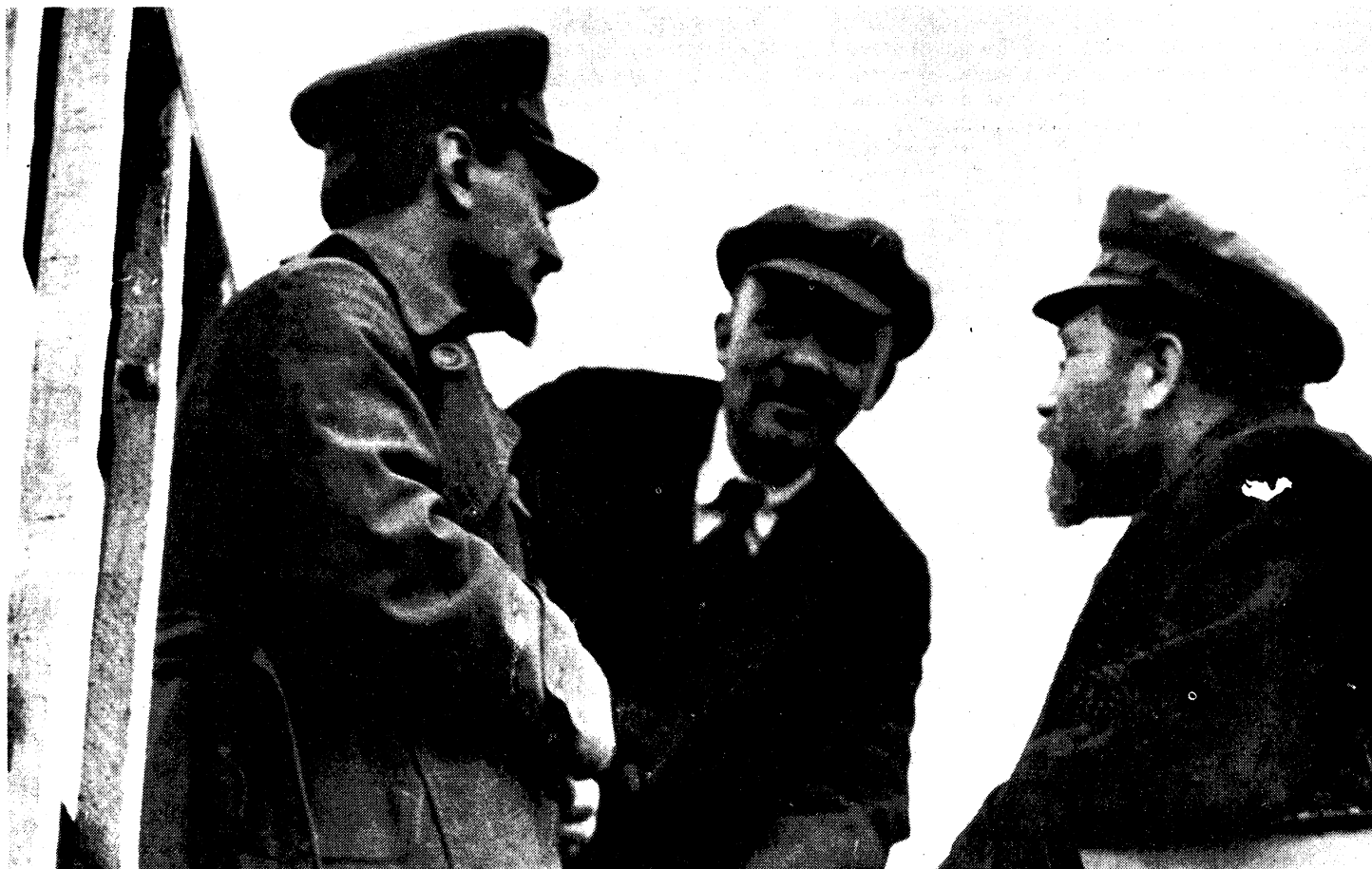
Trotsky, Lenin y Kámenev discutiendo durante las sesiones del Segundo Congreso de la III Internacional Comunista en 1919.

partido fuertemente centralizado no hubiésemos tomado el poder. El centralismo significa concentrar el máximo esfuerzo organizativo en la 'meta'. Es la única manera de dirigir a millones de personas en combate contra las clases poseedoras.