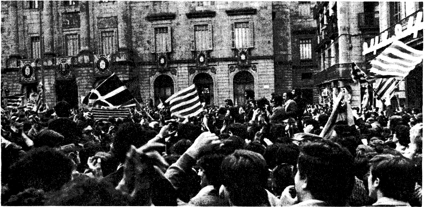
Cuadernos para el Diálogo

Durante la primera campaña electoral desde la Guerra Civil, los pueblos de las naciones oprimidas se manifestaban por todas partes exigiendo autonomía.