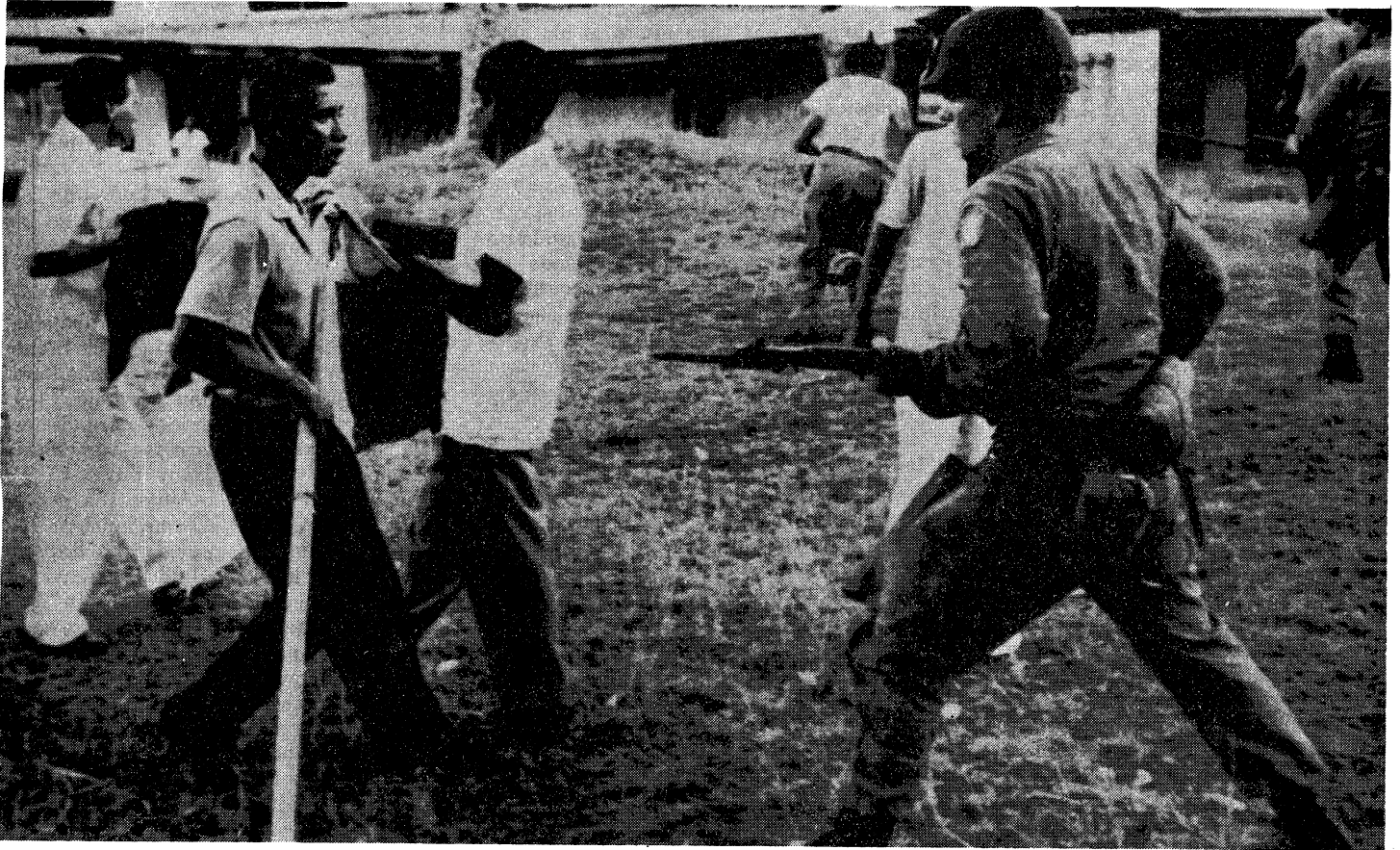
PANAMA, Noviembre de 1959: Tropas norteamericanas impiden implantar bandera panameña en Zona del Canal.