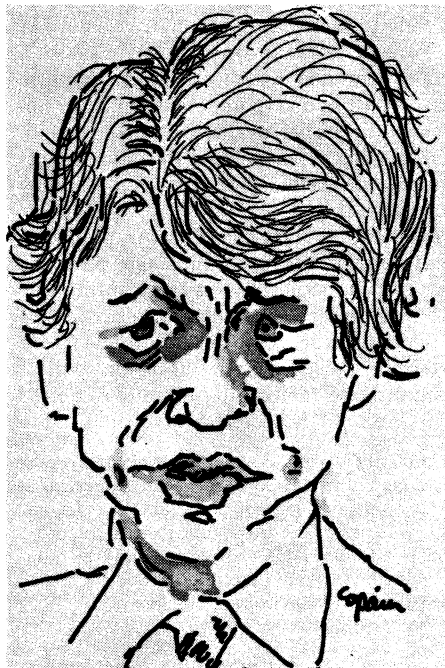
Carter imprime una sonrisa a su política hipócrita.

mica y el Desarrollo, en la que están incluidas todas las potencias imperialistas. La U.S. Steel Corporation y otros grandes productores esperan que estas charlas resultarán en un acuerdo restringiendo las