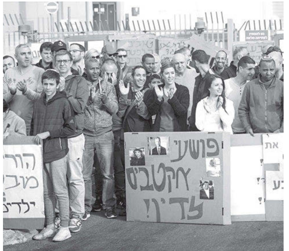
Protesta de trabajadores farmacéuticos de Teva frente a fábrica en Jerusalén, 18 de diciembre.