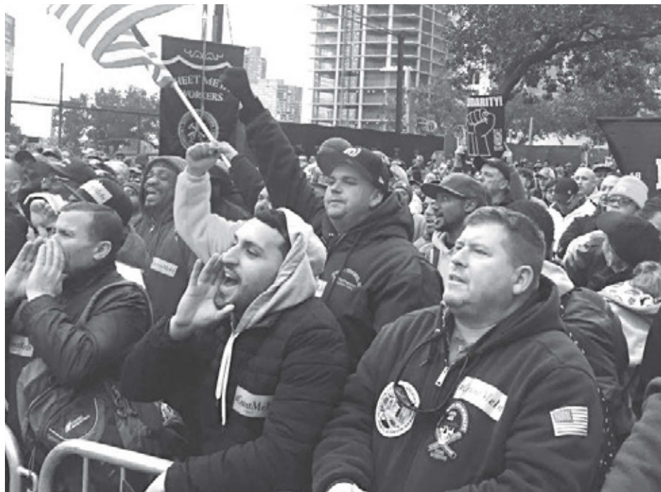
Consejo Central del Trabajo de Nueva York

Obreros de la construcción protestan contra ataques a sindicato, Nueva York, 14 de noviembre.