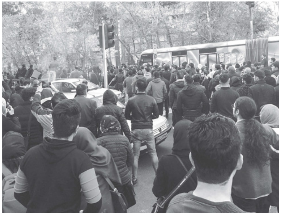
Protesta en Teherán el 30 de diciembre. Reflejando el descontento hacia la política bélica y medidas económicas del gobierno iraní, miles de trabajadores y otras personas salieron a las calles a protestar en 80 ciudades y pueblos por todo Irán.

El 5 de enero miles de personas en un partido de fútbol en Tabriz, en la provincia iraní de Azerbaiyán del Este, se pusieron de pie y corearon, “El pueblo de Azerbaiyán no acepta la humillación”. Un video de la protesta fue publicado por el internet. El 7 de enero más de 100 personas se reunieron afuera de la prisión en Evin, Teherán, para exigir la libertad de los que fueron arrestados durante