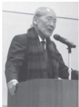
La Sociedad Internacional para el Estudio de los Chinos de Ultramar (ISSCO) se creó hace 25 años para corregir la carencia de estudios académicos sobre inmigrantes chinos por todo el mundo, dijo Wang Gungwu (recuadro), cofundador de ISSCO, en la conferencia de la sociedad celebrada en Nagasaki, Japón, el 18 de noviembre.