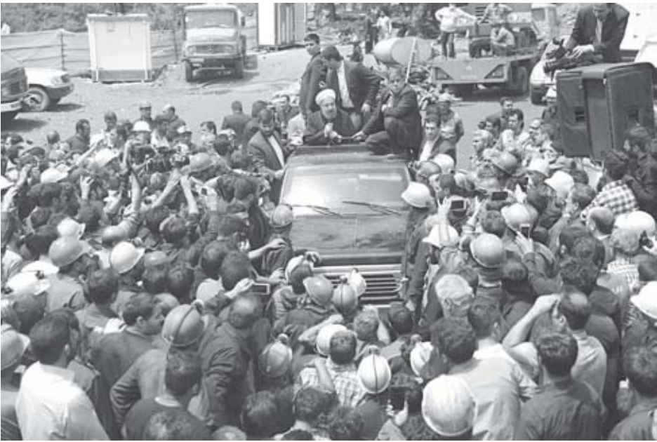
Despacho del Presidente de Irán

Los gobernantes sauditas ahora están siguiendo este curso, con el apoyo abierto de Washington y el respaldo apenas disimulado de la clase dominante y el gobierno de Israel. Riyadh ya ha excarcelado a la mayoría de los cientos