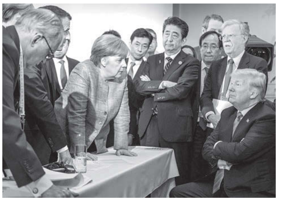
Jesco Denzel/Gobierno Federal de Alemania

La subyugación de la mujer “no es inherente a la naturaleza humana”, dijo Waters. No se origina en conflictos entre