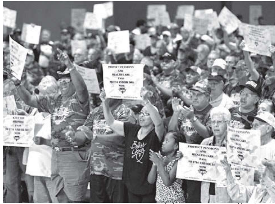
Mineros de unión UMW protestan en Lexington, Kentucky, junio 2016, cortes en pensiones, salud.

Trabajadores necesitan pensiones a escala sindical