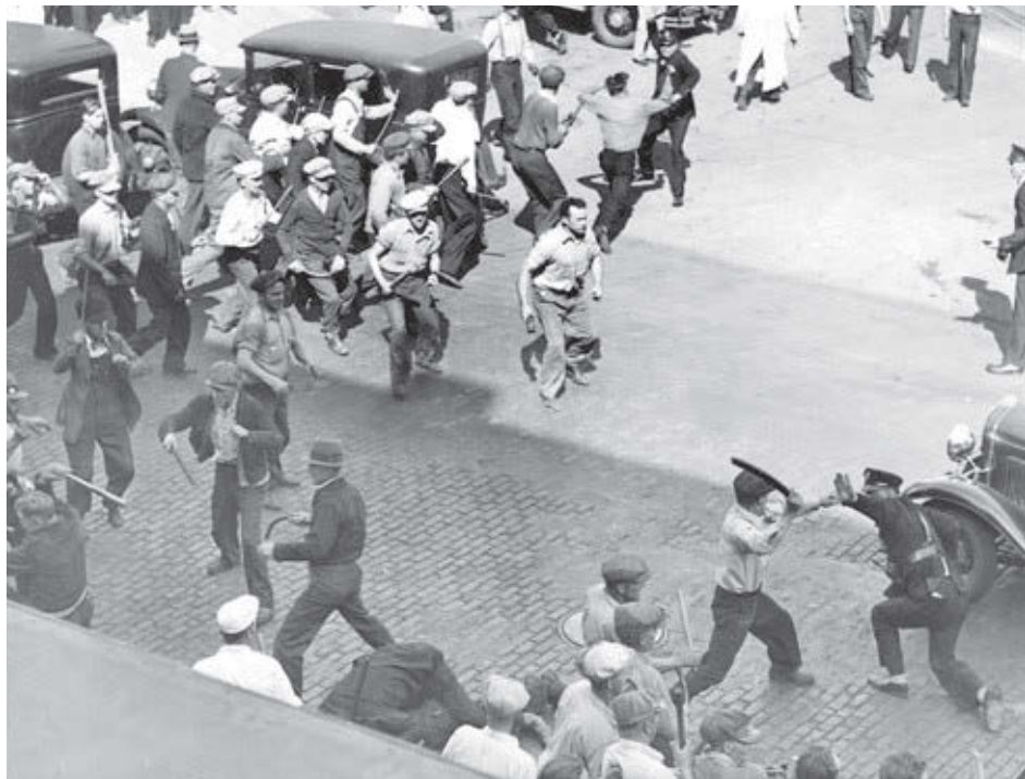
Biblioteca del Condado de Hennepin

Dobbs describe la amplia campaña pública organizada por el partido y sindicalistas, que obtuvo un vasto apoyo del movimiento sindical, la Unión Americana de Libertades Civiles, la Asocia-