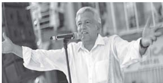
Arriba, protesta en Guadalajara, 26 de septiembre de 2015, aniversario de “desaparición” de 43 estudiantes de Ayotzinapa. El crimen y narcotráfico es una crisis para trabajadores. Izquierda, presidente electo Andrés López Obrador.

tración, y elogió los planes de inversión en la infraestructura y la industria petrolera. Slim dijo que las propuestas de López Obrador para recortar el gasto gubernamental eran positivas, “sobrias y austeras”.