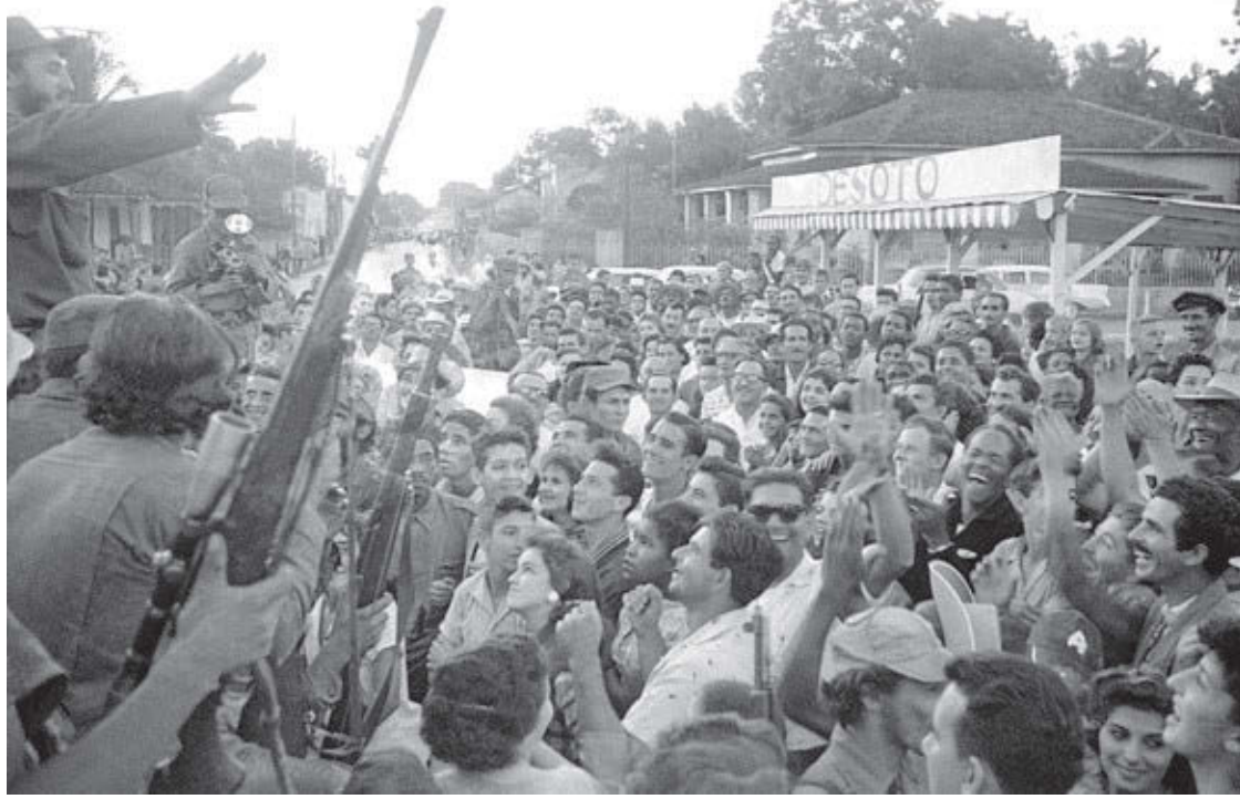
El pueblo en Colón, Cuba, saluda a Fidel Castro (arriba izq.), el 7 de enero de 1959, rumbo a La Habana. Castro dirigió a trabajadores y campesinos al triunfo, y luego a millones de cubanos en defensa de la revolución socialista.

Los une y los concita el miedo. Lo explica el miedo. No el miedo a la Revolución Cubana; el miedo a la revolución latinoamericana. No el miedo a los obreros, campesinos, estudiantes, intelectuales y sectores progresistas de