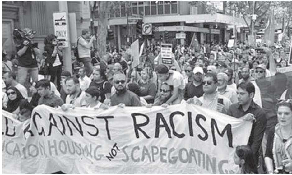
Marcha en Melbourne, Australia, 15 de marzo, condena ataque armado antiinmigrante contra dos mezquitas en Nueva Zelanda que mató a 50 feligreses.

A continuación publicamos la declaración emitida el 16 de marzo por la Liga Comunista en Nueva Zelanda.