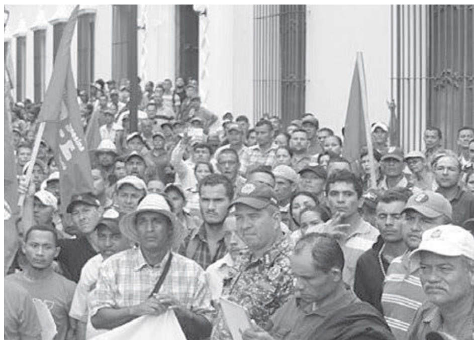
Corriente Revolucionaria Bolívar y Zamora

Después que detuvieron a su esposo por segunda vez, ella renunció a su trabajo. “Llevo a mi esposo al trabajo. Luego a los niños a la escuela. Más tarde en el día, lo recojo del trabajo y a los niños de la escuela”, dijo. “Si él pudiera obtener una licencia, yo po-