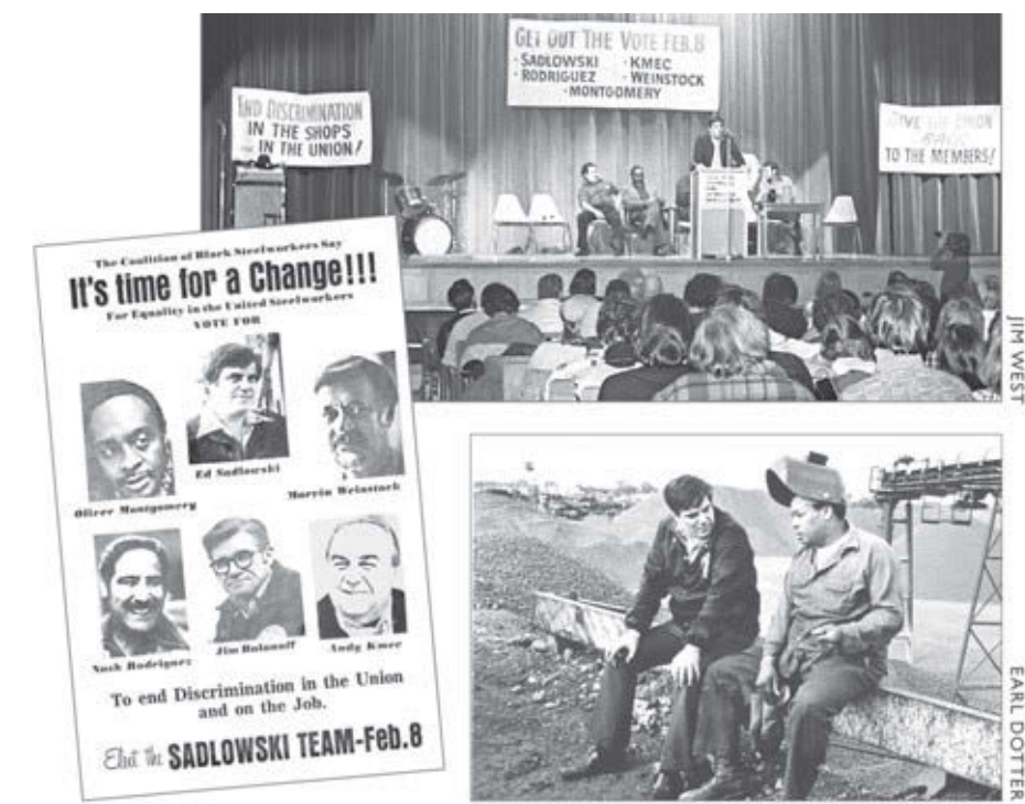
Imágenes de la campaña Obreros del Acero Resisten dirigida por Ed Sadlowski en 1977 tomada de El viraje a la industria: Forjando un partido proletario . Las bases la usaron para enfrentar a la burocracia, combatir la discriminación y luchar por el control democrático de su sindicato.

Son los hombres y mujeres en los niveles bajos y medios de la jerarquía, los agentes de negocios y los organizadores, quienes necesitan ser examinados. Estas personas están directamente encargadas de mantener a raya a los miembros de filas, vigilarlos en situaciones de huelga y sacarlos a votar por los “amigos de los trabajadores” en el Partido Demócrata.