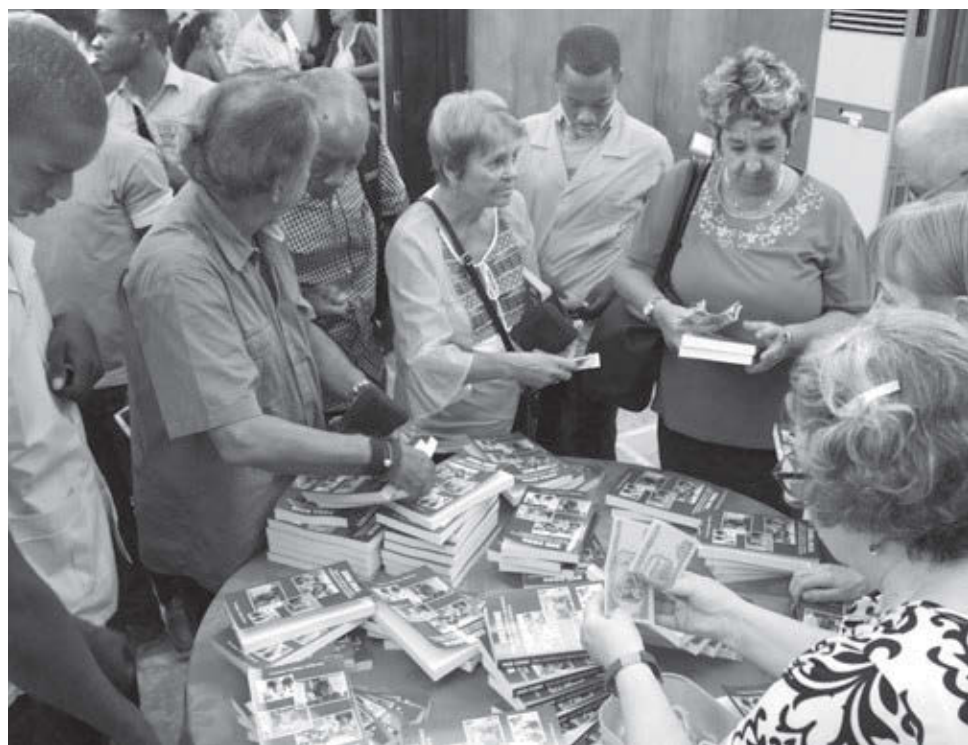
Venta de Zona Roja en español y en inglés después de la presentación del libro.

Dreke encabezó la misión militar cubana en Guinea-Bissau, que apoyó al movimiento de liberación nacional dirigido por Amílcar Cabral en la guerra de independencia contra Por-