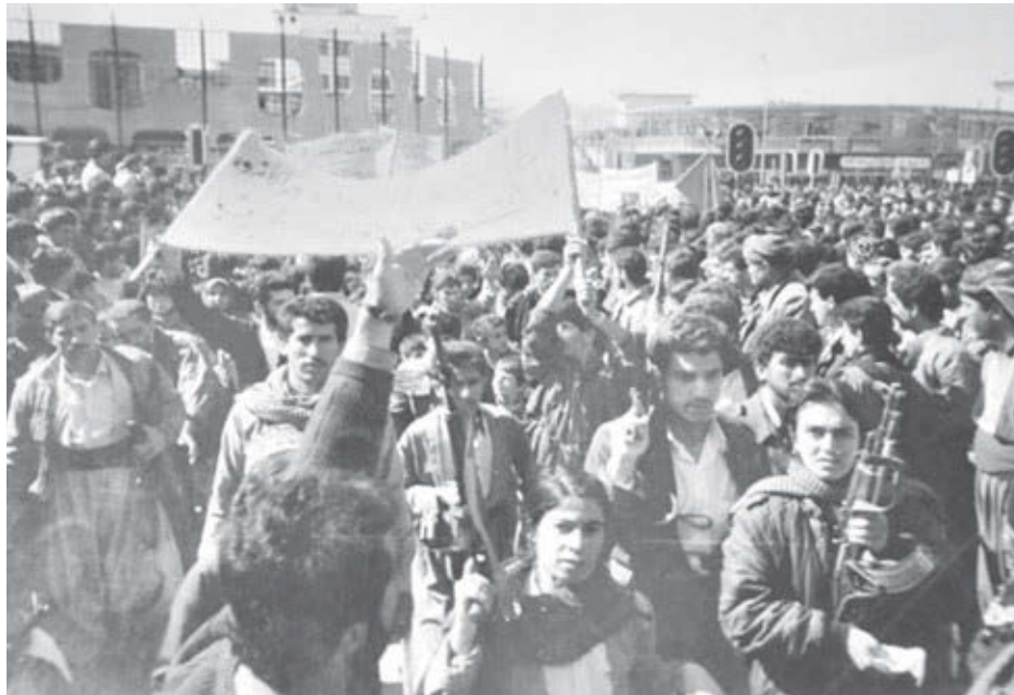
Levantamiento kurdo en Duhok, Iraq, en 1991. Tres años antes, el régimen iraquí de Saddam Hussein, con ayuda de Washington, usó armas químicas para masacrar a los kurdos en Halabja.

La lucha para acabar con las relaciones sociales que producen estas condiciones inmorales de una vez por todas siempre empieza con las luchas que los trabajadores están librando hoy día en sus centros de trabajo. ¡Ve a trabajar y únete a las luchas!