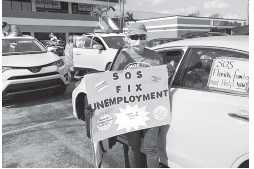
UNITE HERE Local 355

Trabajadores de hoteles y restaurantes en Miami desempleados por ordenes de confinamiento participan en caravana sindical contra retrasos en los subsidios de desempleo, el 19 de abril.