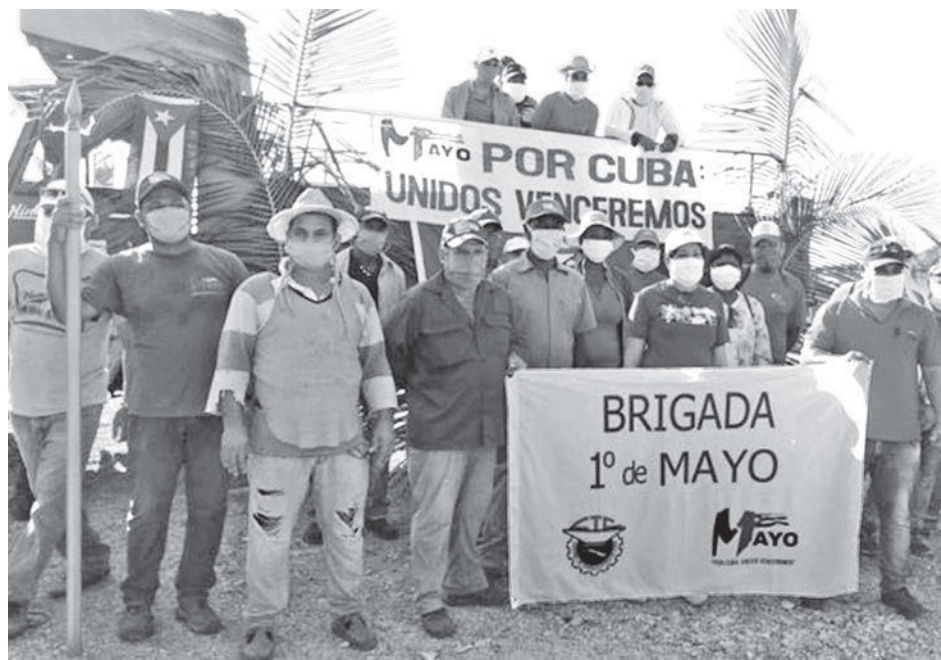
Trabajadores/Gretel Díaz Montalvo

Brigada de trabajo iniciada por sindicalistas en provincia de Camagüey, Cuba. Los voluntarios la nombraron Brigada 1 de Mayo, en honor al desfile anual que no se podrá celebrar esta vez.