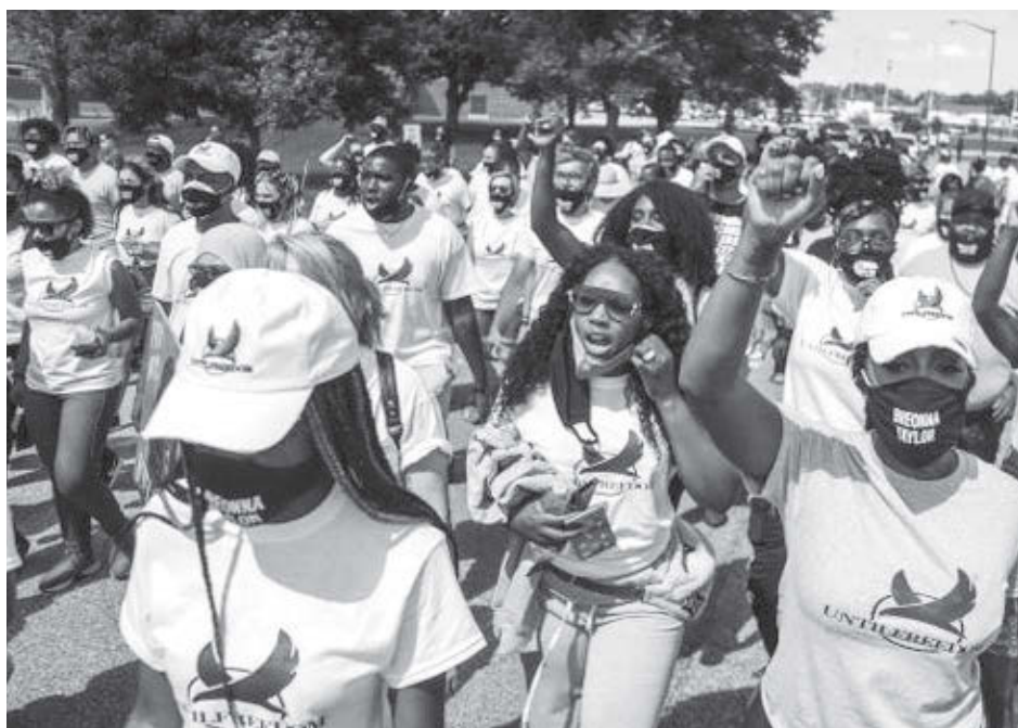
Manifestantes marchan a casa del fiscal general de Kentucky Daniel Cameron en Louisville el 14 de julio para exigir que se imputen cargos a los policías que mataron a Breonna Taylor.