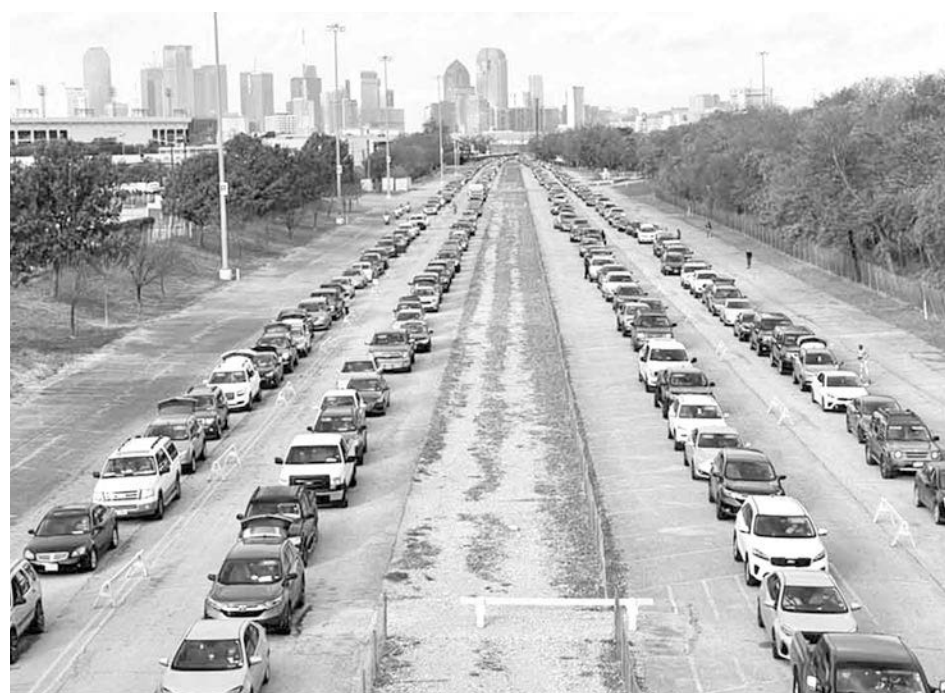
Unas 8 500 familias, 17 veces más que el año anterior, esperaron hasta 12 horas para recibir un pavo y otros alimentos para el Día de Acción de Gracias en banco de alimentos en Texas.