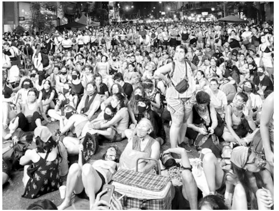
Decenas de miles de partidarios de los derechos de las mujeres participan en manifestación el 30 de diciembre en Buenos Aires, Argentina, mientras Senado debatía y votaba sobre ley para la legalización del aborto.

“Estoy segura de que esta victoria impactará a otros países de América