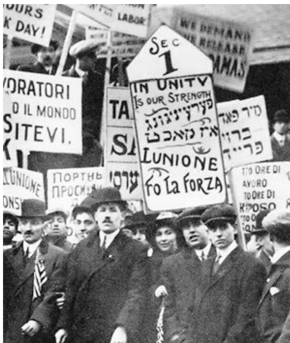
Protesta de obreros textiles en Nueva York en 1913. Huelguistas portan carteles en idish, italiano, ruso e inglés.

Describe cómo los comerciantes judíos también se convirtieron en prestamistas durante el feudalismo y desarrollaron relaciones económicas con reyes, nobles, artesanos y