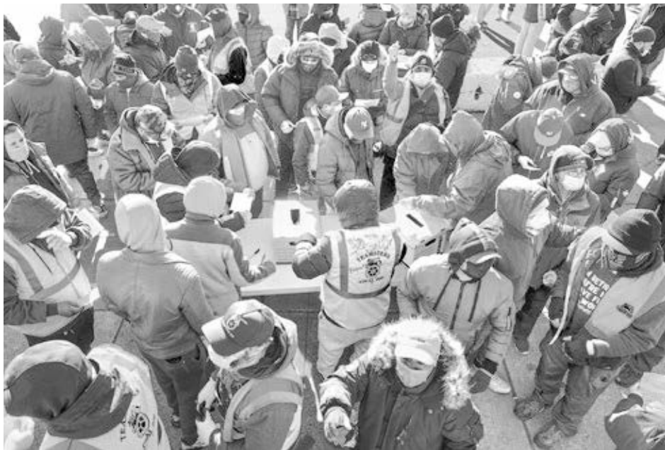
Teamsters Jount Council 16

Tras huelga de una semana, más de mil miembros del sindicato Teamsters en mercado de frutas y vegetales en Nueva York, votaron el 23 de enero a favor de contrato que incluye aumentos.