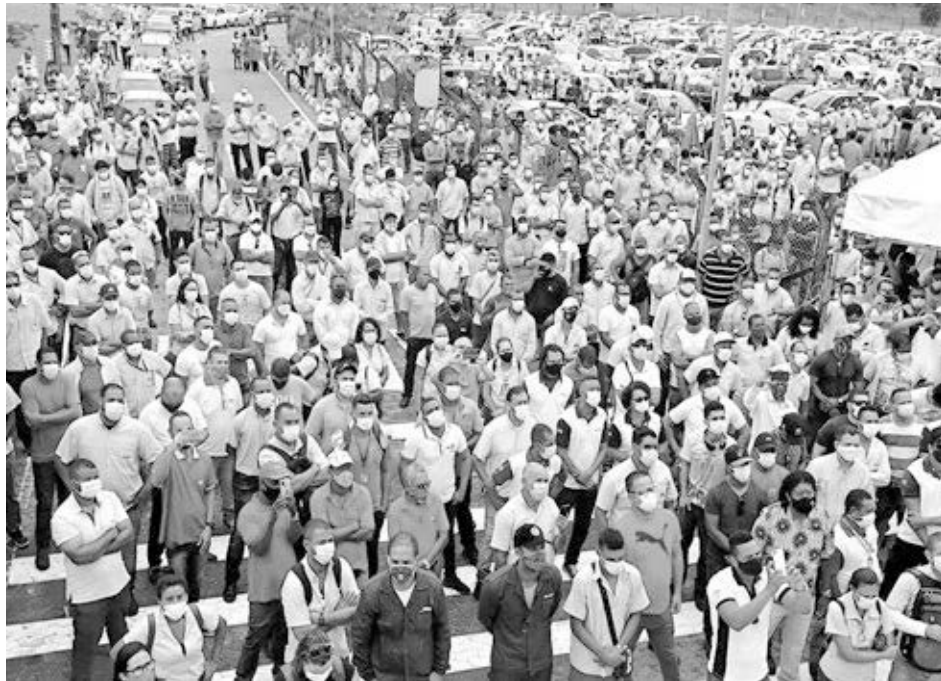
Protesta en Camacari, Brasil, el 12 de enero, contra cierre de fábricas de autos de la Ford.