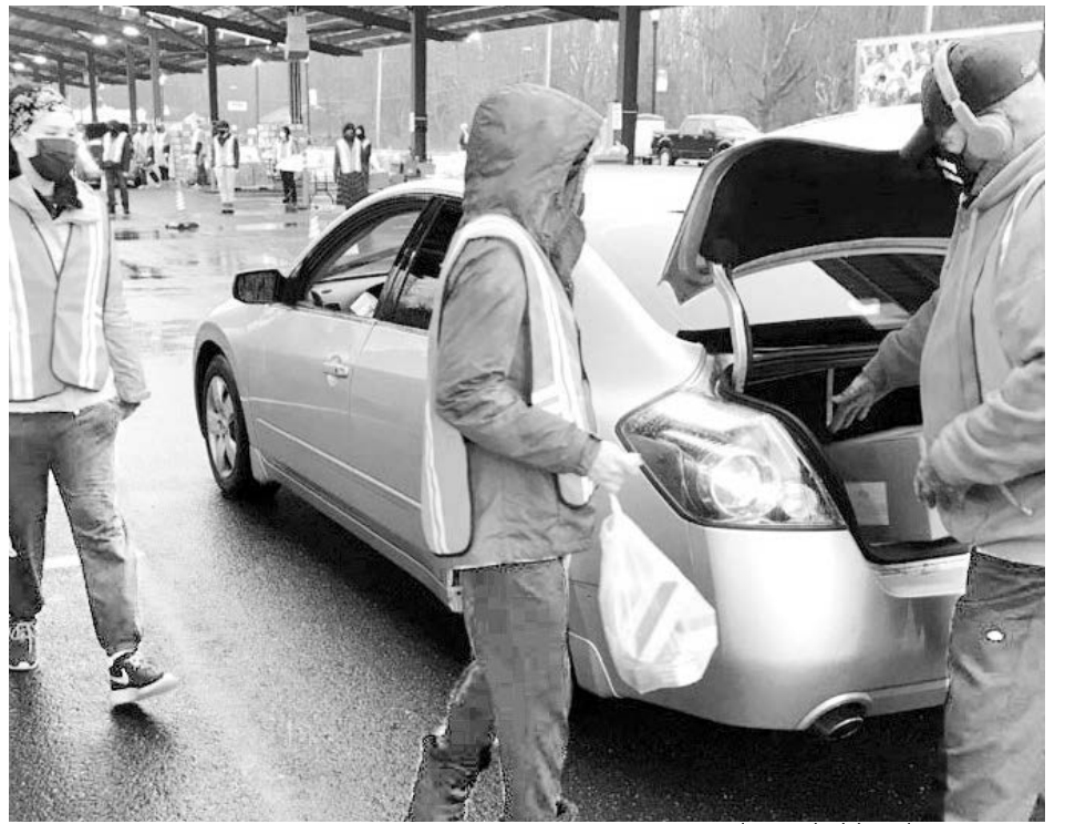
Banco de comida del sur de Nueva Jersey

Mucho antes de la pandemia, millones de trabajadores ya enfrentaban