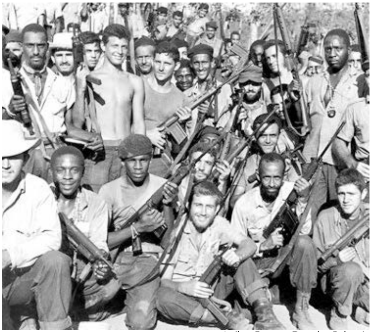
Arriba, Granma. Derecha, Bohemia

Arriba: Milicianos cubanos celebran tras derrota de invasión mercenaria en Bahía de Cochinos organizada por Washington, abril 1961. Derecha: uno de los más de 100 mil voluntarios en la campaña popular y proletaria de alfabetización que transformó a estudiantes y maestros por igual y fortaleció la revolución.