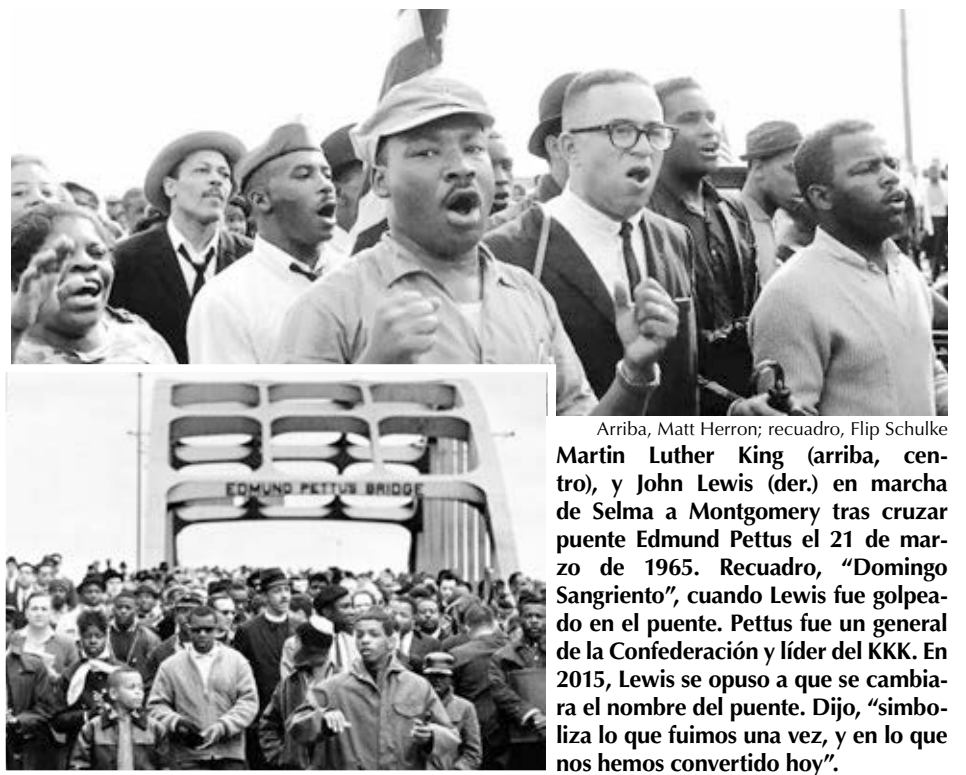
Martin Luther King (arriba, centro), y John Lewis (der.) en marcha de Selma a Montgomery tras cruzar puente Edmund Pettus el 21 de marzo de 1965. Recuadro, “Domingo Sangriento”, cuando Lewis fue golpeado en el puente. Pettus fue un general de la Confederación y líder del KKK. En 2015, Lewis se opuso a que se cambiara el nombre del puente. Dijo, “simboliza lo que fuimos una vez, y en lo que nos hemos convertido hoy”.

Las fuerzas del Talibán tomaron el poder en 1996 y permitieron que Al Qaeda estableciera bases. Al Qaeda estaba dirigida por muchas de las fuerzas guerrilleras que fueron financiadas y ar-