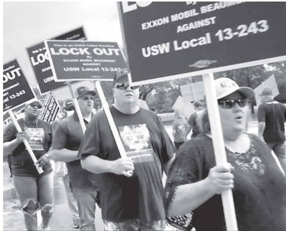
Trabajadores en lucha contra cierre patronal de ExxonMobil protestan frente a sede de la empresa en Irving, Texas, mayo 26. "Quieren destruir el sindicato", dijo el presidente del local.

Unión lucha por seguridad, empleo, antigüedad