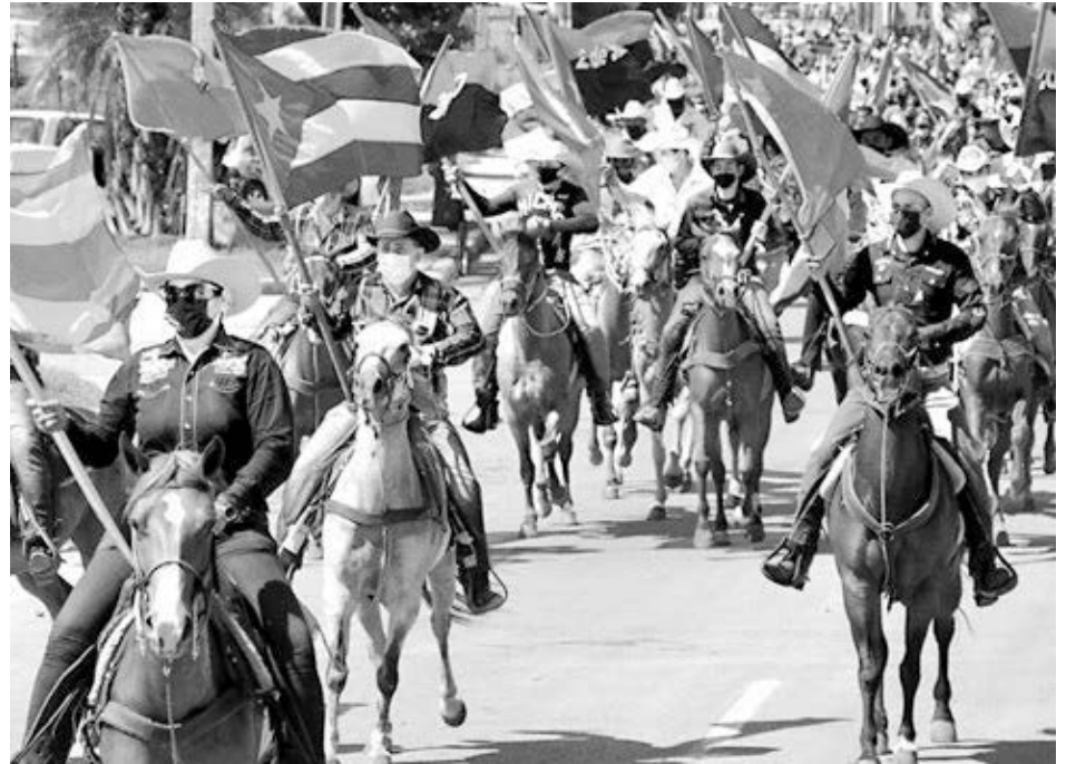
Caravana de 2 mil personas en caballos, patines, bicicletas y carros el 30 de mayo en La Habana contra la guerra económica de Washington contra Cuba.

Ahora se puede suscribir y contribuir online, visite themilitant.com