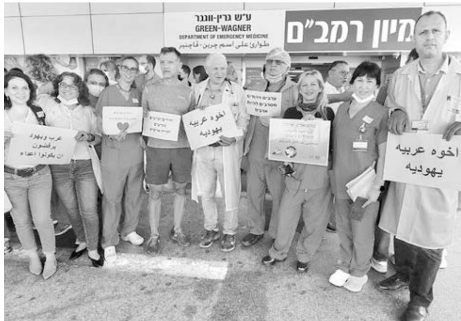
Rambam Health Care Campus

Trabajadores árabes y judíos en centro de salud Rambam en Haifa, 16 de mayo. Letreros en árabe y hebreo leen “judíos y árabes rehusan ser enemigos”. Esto es clave para lucha de clases.