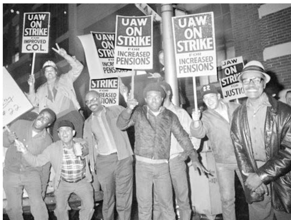
Obreros en huelga en General Motors en Detroit, sept. 14, 1970, cuando la inflación estaba devastando sus salarios. Exigieron aumentos por costo de vida a la par de los aumentos de precios.