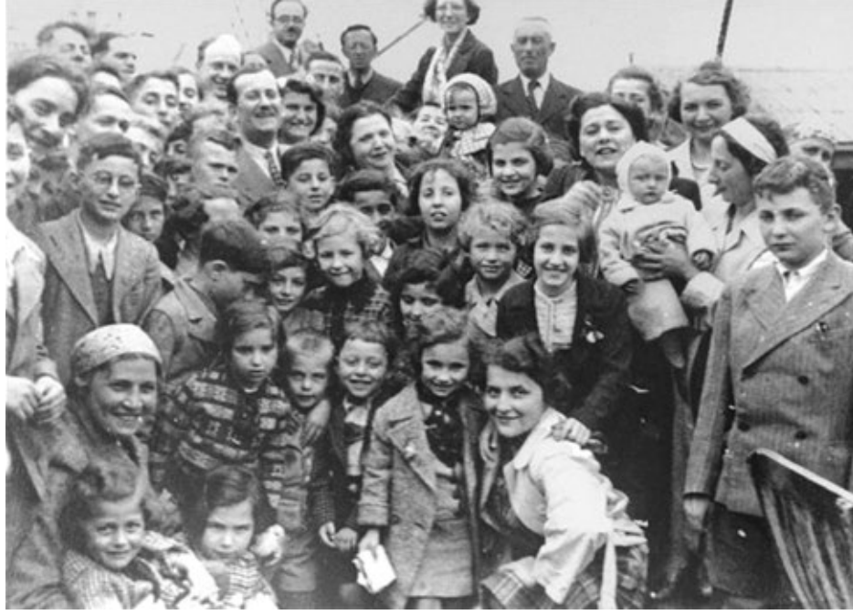
Cientos de pasajeros judíos huyendo de los nazis en el barco St. Louis, arriba, en 1939 fueron forzados a regresar a Europa después que Washington y Ottawa les negaran entrada. Muchos perecieron en el Holocausto. Israel fue fundado después que poderes imperialistas rechazaran a refugiados judíos después de la guerra.