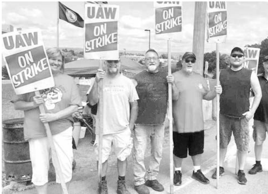
UAW Local 2069

Luchan contra niveles distintos para nuevos empleados