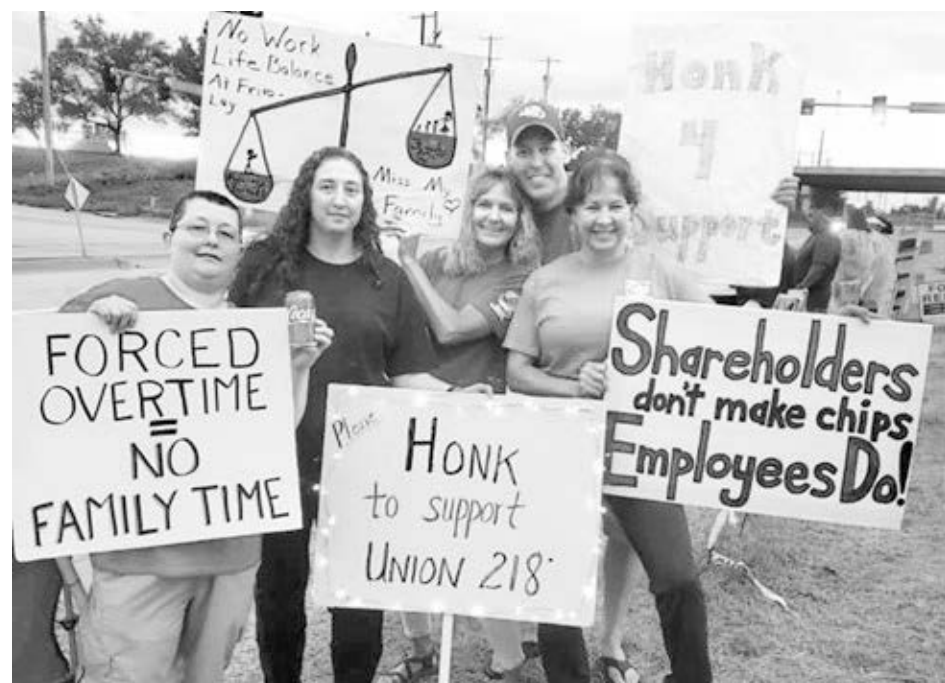
Topeka Frito-Lay Union Members Appreciation Page

Regresaron a trabajar 600 miembros del Local 218 del sindicato BCTGM en Frito-Lay el 26 de julio tras tres semanas de huelga contra horas extras forzadas y bajos salarios. Ganaron amplio apoyo. Cárter a la der. dice "Los accionistas no hacen las papitas, los trabajadores las hacen".