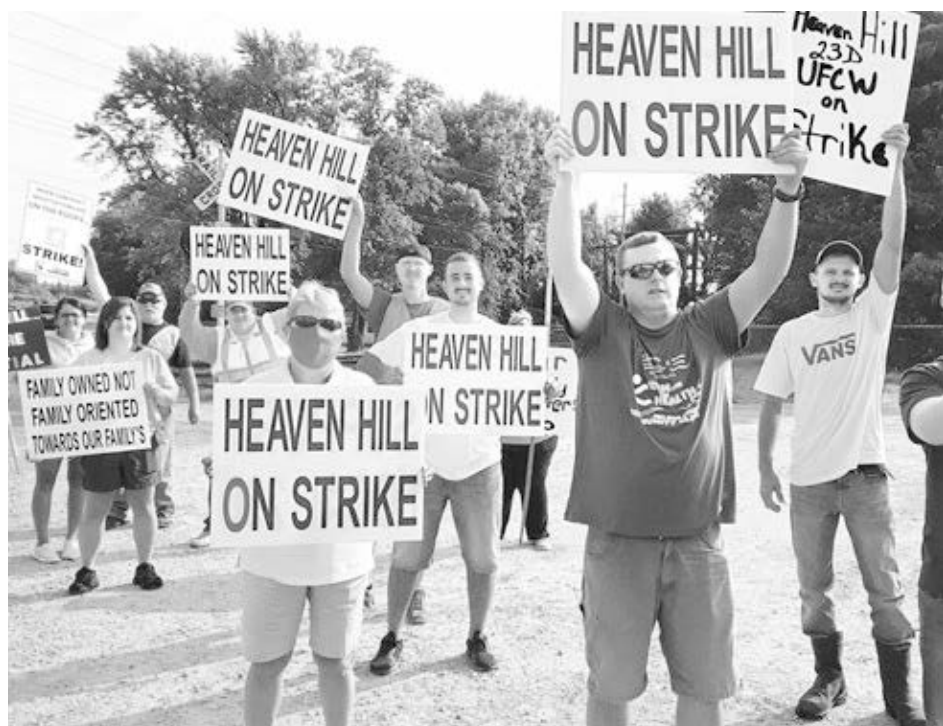
JCAESP AFSCME Local 4011

Luchan contra turnos que causan caos en la vida familiar