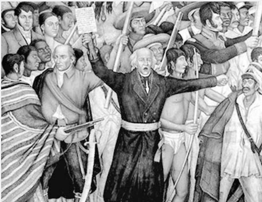
Detalle con Miguel Hidalgo en mural de Juan O’Gorman

El día de la independencia de México se celebra el 16 de septiembre tanto en el país como por mexicanos por todo el mundo. Conmemora el inicio de la lucha de independencia del dominio colonial español en 1810. La noche anterior, el cura católico Miguel Hidalgo convocó a sus feligreses en el pueblo de Dolores y los instó a revelarse, a luchar por la igualdad racial y la repartición de las tierras. El acto se conoce como el Grito de Independencia.