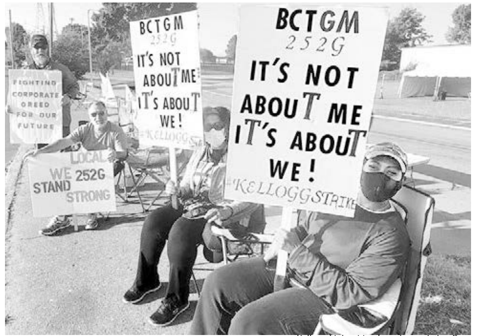
Kellogg Union Members Appreciation Page

La empresa está tratando de continuar la producción con supervisores y personal de oficina. Los patrones están