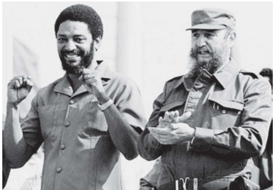
Maurice Bishop, líder de revolución en Granada, con Fidel Castro el 1 de Mayo en Cuba, 1980. Bishop fue “un verdadero revolucionario”, dijo Castro. Pero, “de las filas revolucionarias surgieron hienas” que “hundieron la revolución y abrieron las puertas a la agresión imperialista”.

Fidel Castro ha caracterizado correctamente a Bernard Coard como “un supuesto teórico de la revolución, que había sido profesor de marxismo en Jamaica”. Coard buscó establecerse a sí mismo y a su grupo como “una especie