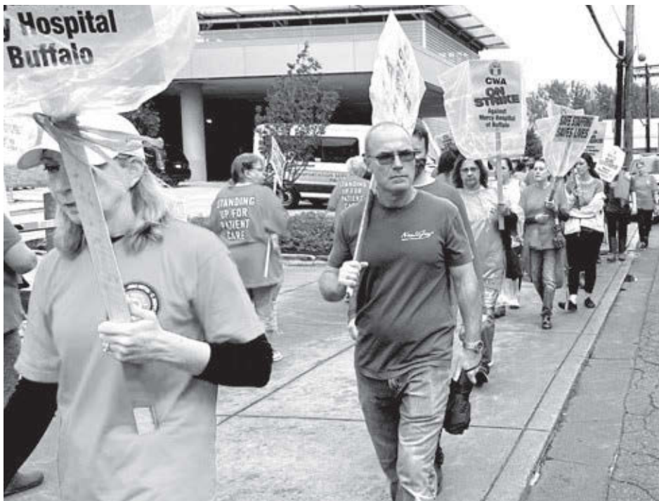
Communications Workers of America District 1

Trabajadores de la salud en línea de piquetes frente a Mercy Hospital en Buffalo, Nueva York, el 12 de octubre, tras 12 días de huelga contra reducción de personal y por mejores salarios.