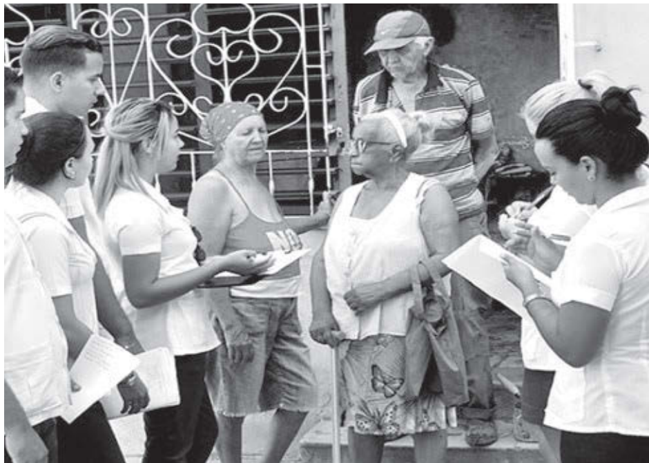
Radio Grito de Baire

Un pueblo convencido, no mandatos de vacunas