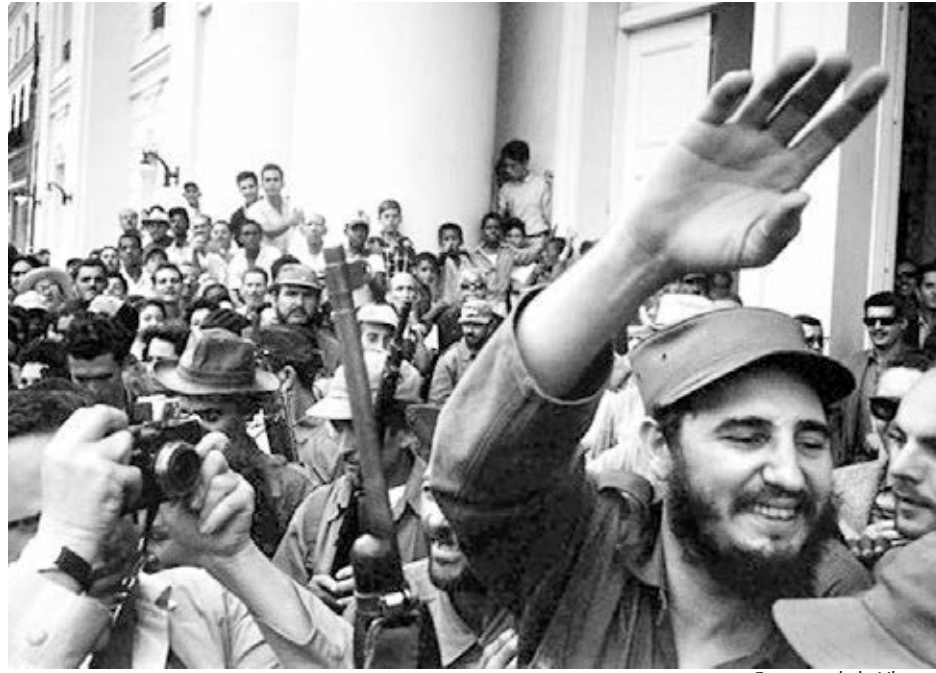
Caravana de la Libertad

La lucha revolucionaria se inició tras el golpe de estado de Batista, cuando una vanguardia de hombres y mujeres se unieron para luchar contra la dictadura. Liderados por Castro, asaltaron el Cuartel Moncada en Santiago el 26 de