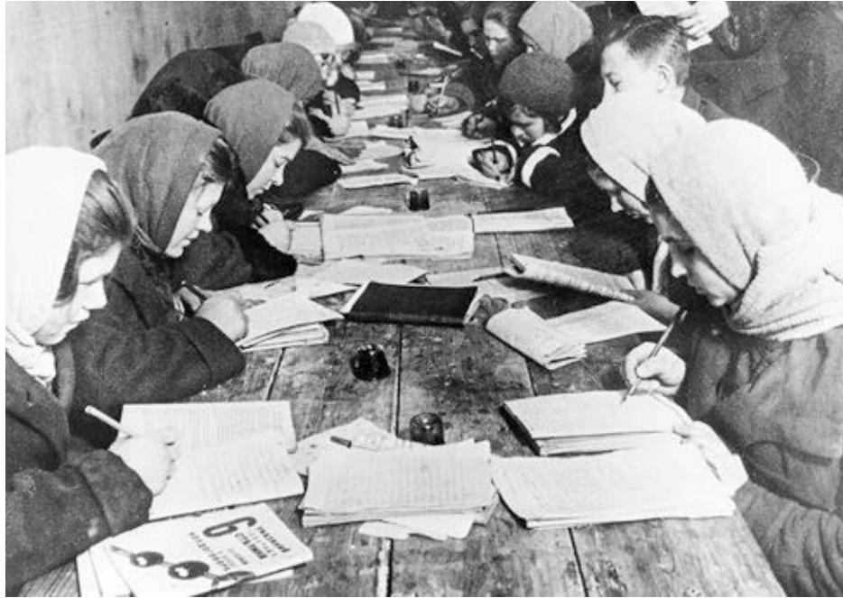
Clase para mujeres en fábrica en Moscú. Tras la Revolución Rusa en 1917, el gobierno soviético liderado por Lenin ayudó a la mujer a dar grandes pasos, incluyendo campañas de alfabetización en 1919. Luchó por la igualdad de derechos, brindó cuidado infantil y despenalizó aborto.

Esto fue parte de una campaña más amplia para involucrar a los trabajadores y agricultores en la lucha para lograr la plena igualdad legal de la mujer a la par con los hombres. Las leyes sobre los derechos de la mujer codificadas en 1921 garantizaban a las mujeres el derecho al divorcio, reservado solamente para los hombres durante el régimen zarista. Se prohibió la discriminación en el empleo basada en el sexo y se hizo cumplir la jornada de ocho horas. Guarderías infantiles operadas por el estado se proporcionaron de forma gratuita a medida que más mujeres ingresaban a