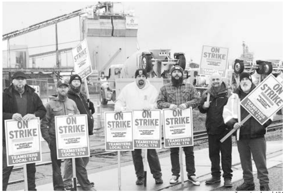
Teamsters Local 174

La huelga, ya en su décimo mes, comenzó después de que los miembros del sindicato se negaran abrumadoramente a aceptar otro contrato de cinco años con concesiones. Siguen decididos a recuperar mejoras en los salarios, prestaciones,