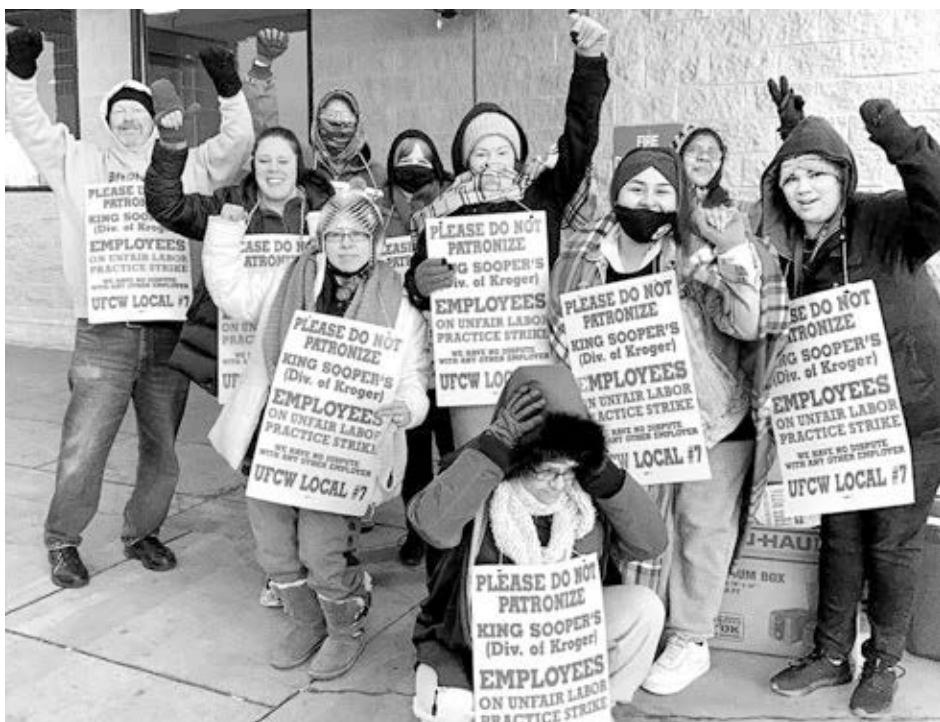
UFCW Local 7R

Trabajadores de tiendas King Sooper en Aurora, Colorado, durante huelga de 10 días que hizo logros. Capitalistas ponen el peso de la crisis de su sistema sobre las espaldas de los trabajadores, pero ninguno de los partidos de los patrones es capaz de proveer estabilidad política.