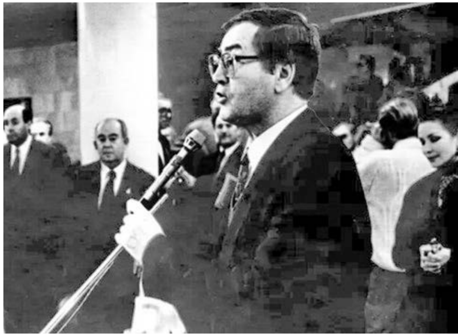
Iván Dzyuba habla en Kyiv en 1965 en premier del filme, “Sombras de los ancestros olvidados”. El filme celebró la cultura ucraniana, en contraste con la ortodoxia estalinista. Dzyuba condenó el arresto de 100 jóvenes e intelectuales por sus criterios y actividades anti estalinistas.

Los invitados internacionales pueden ayudar a denunciar el carácter “extraterritorial” de la guerra económica de Washington, dice la convocatoria, “que constituye el principal obstáculo para el desarrollo económico y social del país”.