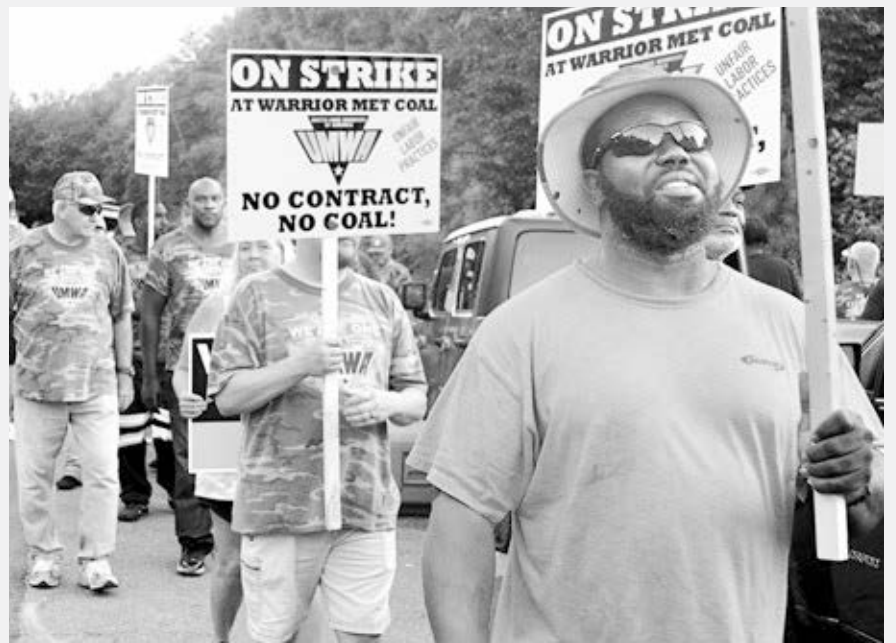
Sindicato minero UMWA

¡Únase a protesta de mineros de Warrior Met el 6 de abril!