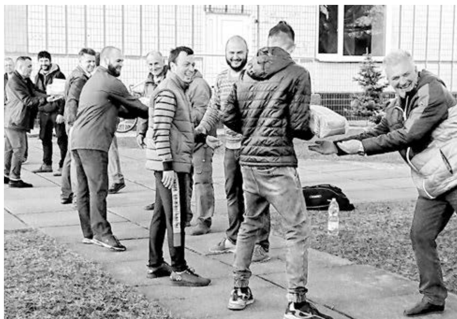
Chernobyl union Youth Organization

Continúa la oposición en Rusia a guerra de Putin