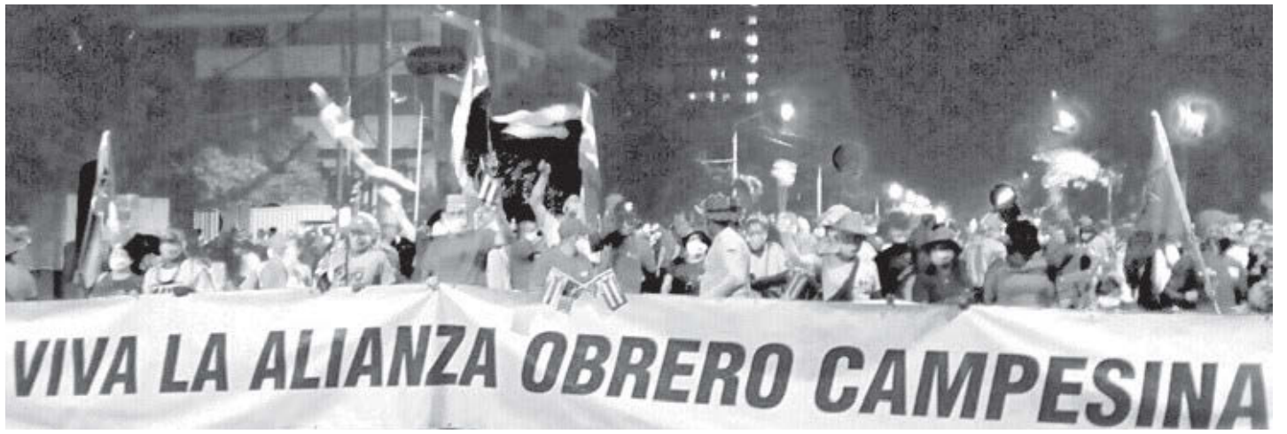
Desfile del Primero de Mayo en La Habana. La alianza obrero campesina ha sido esencial para la revolución socialista cubana. ANAP

También hubo contingentes grandes de sindicatos afiliados a la Central de Trabajadores de Cuba (CTC), desde constructores y maestros hasta em-