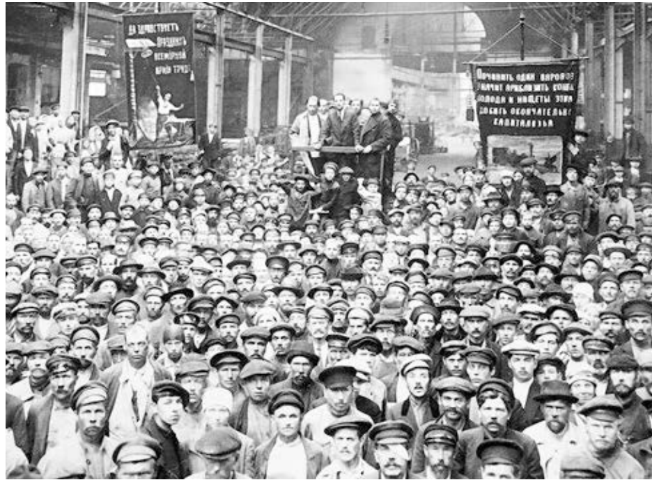
El capitalismo ha producido muchas cosas, buenas y malas, durante su evolución. La fuerza social más vital que ha creado es la clase trabajadora. Arriba, obreros en fábrica de locomotoras Putilov en Petrogrado, Rusia, se reúnen para elegir diputados al soviét municipal, julio 1920.

Necesitamos forjar nuestro propio partido, un partido obrero, que actúe sobre los intereses que compartimos y promueva un curso de lucha intransigente en pos de las necesidades de nuestra clase. Por ese camino, los trabajadores y