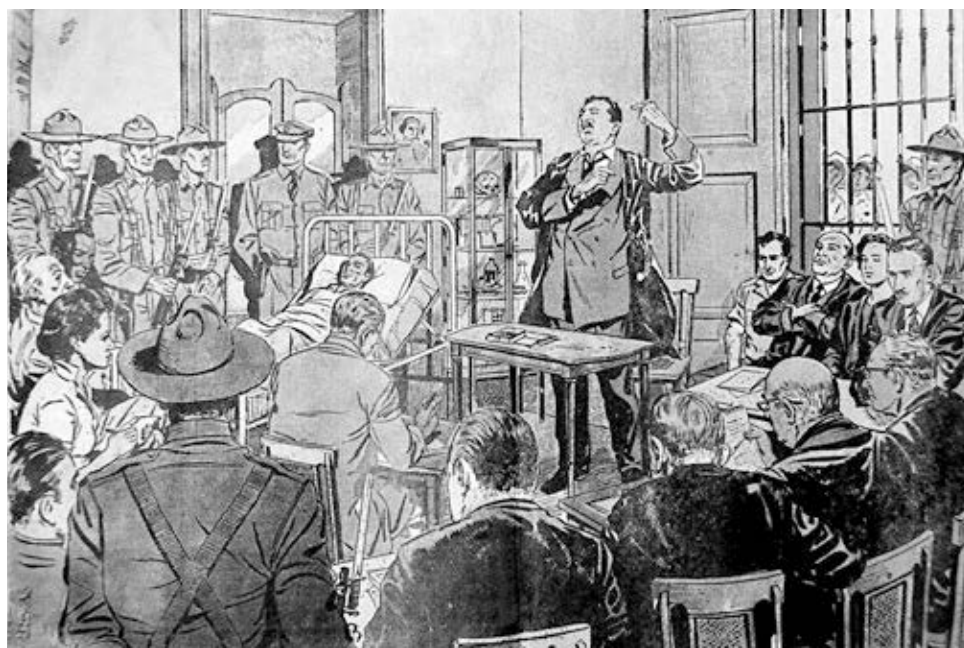
Fidel Castro presenta su alegato durante juicio que lo condenó junto a otros 31 combatientes por el asalto al cuartel Moncada el 26 de julio de 1953. Su discurso conocido como La historia me absolverá fue el programa de lucha por verdadera independencia de Cuba y la revolución socialista.

“El Partido Socialista de los Trabajadores no existiría como el partido proletario que somos hoy si no fuera por la