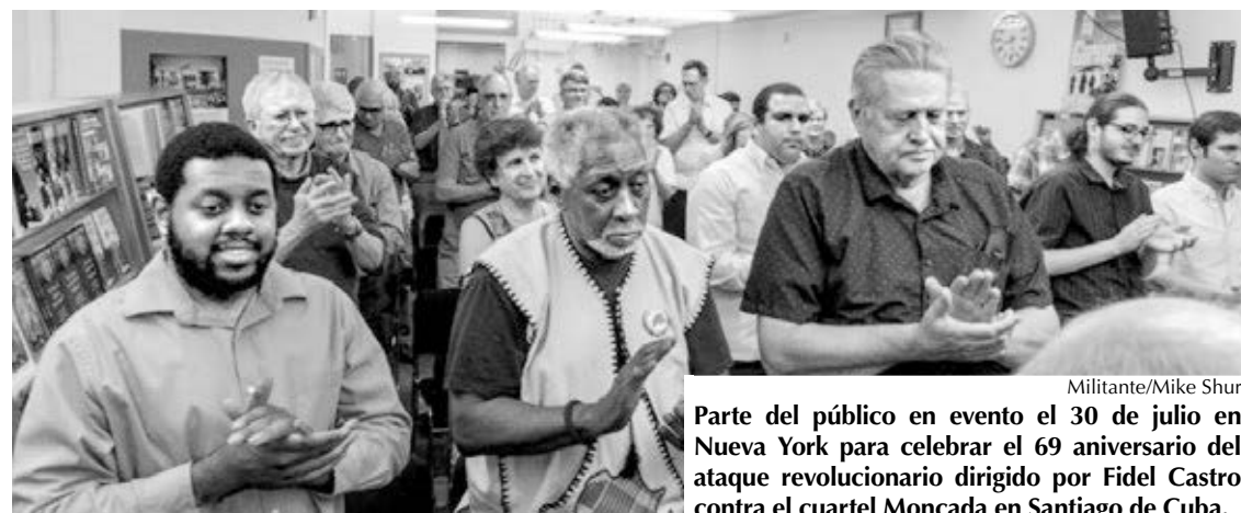
Parte del público en evento el 30 de julio en Nueva York para celebrar el 69 aniversario del ataque revolucionario dirigido por Fidel Castro contra el cuartel Moncada en Santiago de Cuba.

El programa finalizó con un brindis encabezado por Clark y Gala por los 160 combatientes que abrieron la lucha por la verdadera independencia y la revolución socialista de Cuba en 1953, así como por el fin de la guerra económica de Washington y las restricciones de viaje contra la Revolución Cubana.