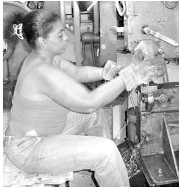
Operaria en Villa Clara, Cuba, 2019. Tras la victoria revolucionaria, la proporción de mujeres en la fuerza laboral fue creciendo, incluso en empleos “no tradicionales”.

familiares para compartir la responsabilidad del bienestar de los parientes ancianos.