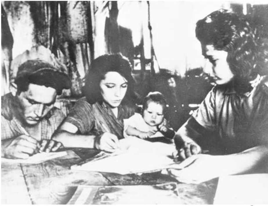
Miembros de familia campesina aprenden a leer y escribir, 1961. Las jóvenes fueron la mayoría de los 250 mil voluntarios que erradicaron el analfabetismo en un año. La determinación de las mujeres de participar en la revolución derribó barrera tras barrera heredada del capitalismo, al tiempo que el pueblo trabajador fue cobrando confianza en sus propias capacidades.