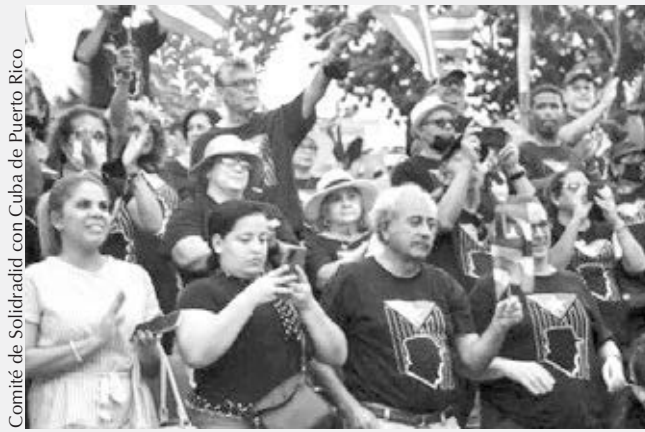
Comité de Solidaridad con Cuba de Puerto Rico

Desde el 23 de agosto, agentes del FBI han estado tratando de interrogar a más de 35 personas en la colonia norteamericana de Puerto Rico que participaron recientemente en una brigada de solidaridad a Cuba. El FBI tiene una larga y sórdida historia de hostigamientos y fabricación de casos contra partidarios de la independencia, defensores de la Revolución Cubana, luchadores sindicales y otros en la isla.