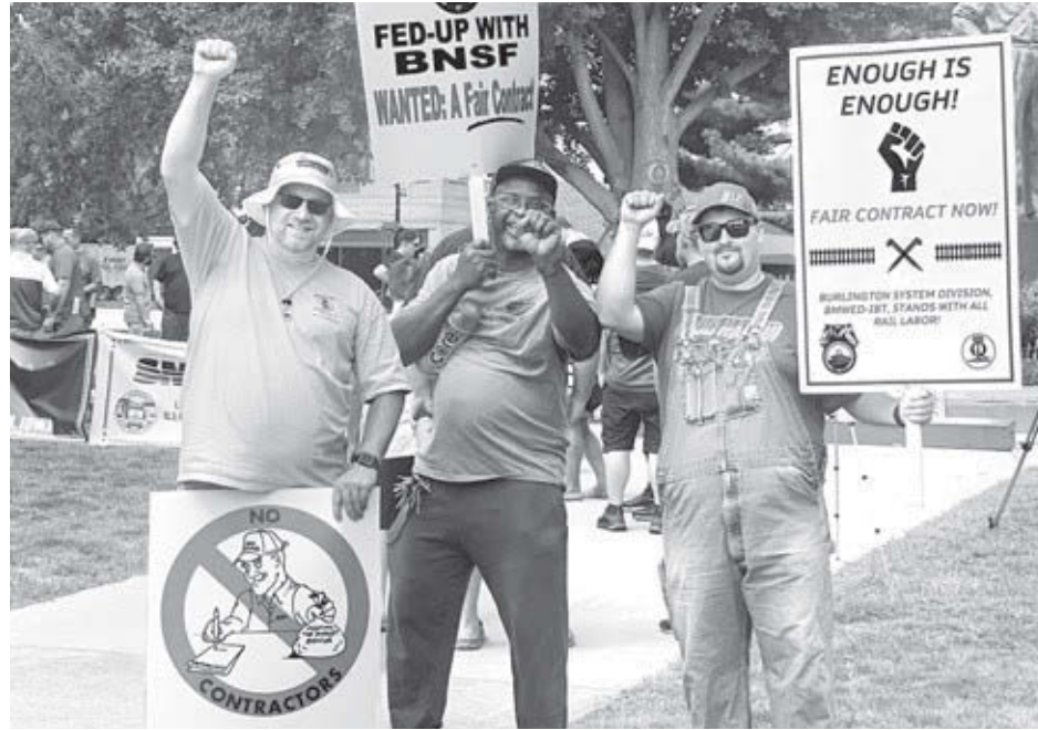
Brotherhood of Maintenance of Way

Obremos ferroviarios protestan en Galesburg, Illinois, el 30 de julio. Sindicatos dicen que propuesta de Junta Presidencial no cubre las demandas sindicales sobre calidad de vida.