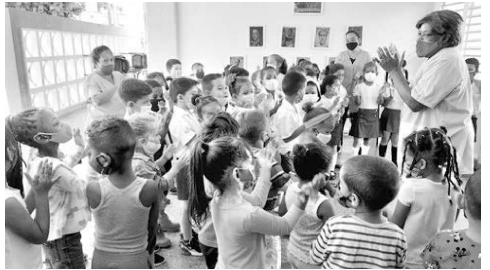
Círculo Infantil La Nueva Flor, Sandino, Pinar del Río

Esto también ha contribuido a la deserción escolar y pérdida de oportunidades de empleo por las adolescentes