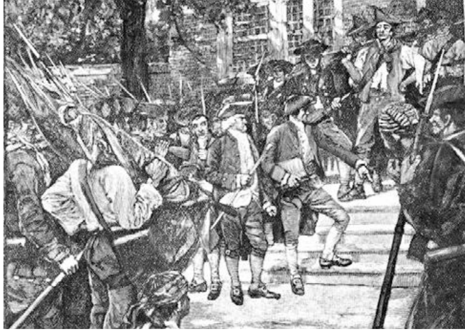
Parte del cuadro de Howard Pyle de 1883, "La rebelión de la turba de Shays en posesión de una corte". En 1786, granjeros en Massachusetts durante Rebelión de Shays. Muchos, como su líder, Daniel Shays, eran veteranos de la Guerra Revolucionaria. Estas revueltas contribuyeron a la aprobación de la Carta de Derechos que fortaleció la Constitución y protecciones contra el gobierno.

El extracto incluye actas del proceso en la corte federal ocurrido durante la