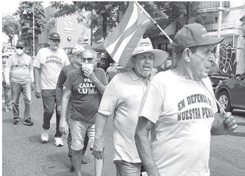
Asociación de Jubilados de la Autoridad de Energía Eléctrica

Jubilados en protesta semanal en sede de Autoridad Eléctrica en San Juan. En protesta el 21 de sept., tras el ciclón, corearon “Ni Fiona, ni Luma, ni la Junta para nuestra lucha”.