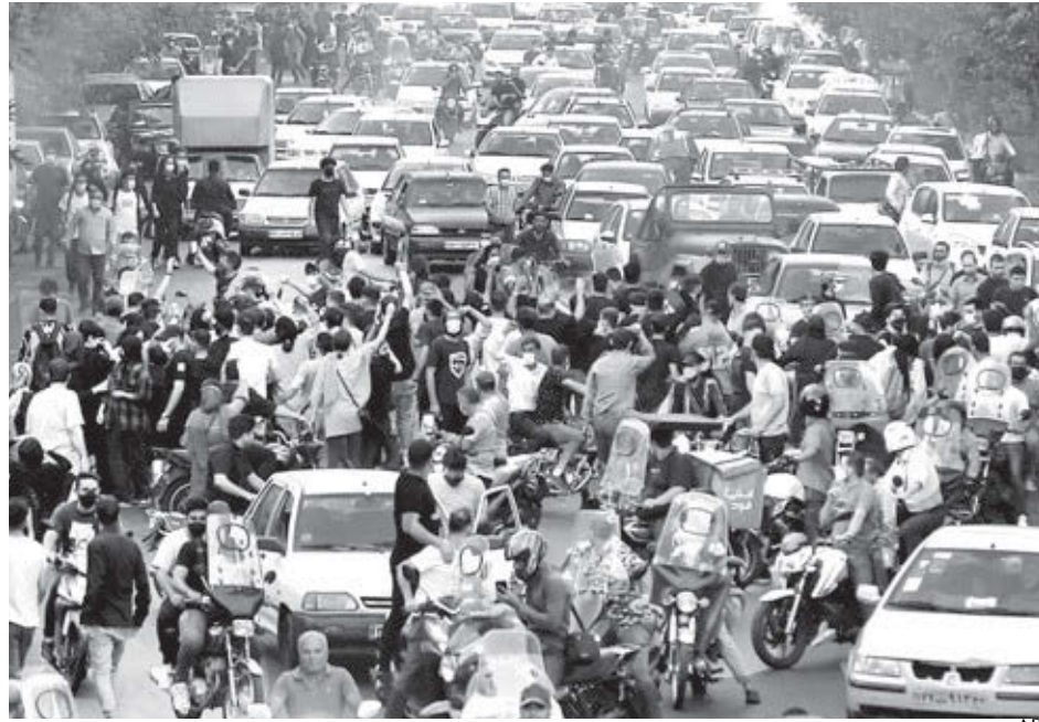
Manifesteros bloquean tráfico en Teherán, 21 septiembre. Protestas se han esparcido a todas las provincias y más de 80 ciudades en Irán y región Kurda de Iraq y por el mundo.