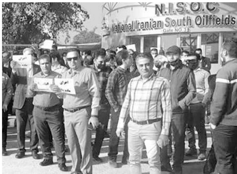
Organizing Council of Oil Contract Workers of Iran

La Unión Nacional de Jubilados informa que la tasa anual de inflación de alimentos llegó al 63.4% en noviembre, cifra que, según afirma, nunca antes se