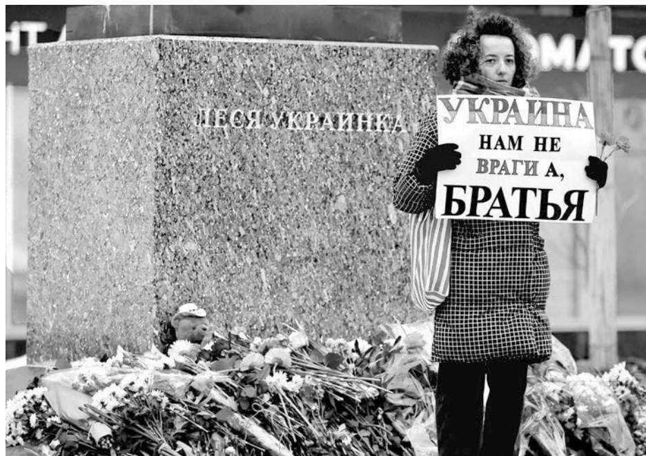
“Ucrania: no nuestros enemigos sino nuestros hermanos”, dice cartel de mujer en monumento a poeta ucraniana Lesya Ukrainka en Moscú, 21 de enero. Ofrendas en 50 ciudades contra ataque de Moscú a edificios de apartamentos en Dnipro muestran oposición a guerra de Putin.

Apoye independencia, soberanía de Ucrania