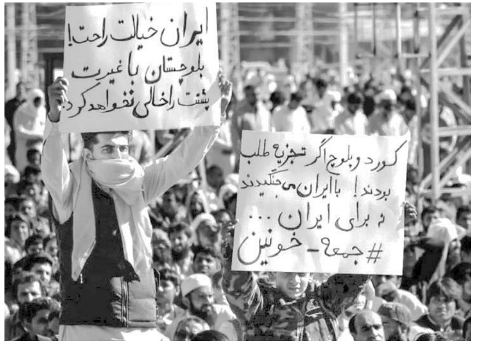
Marcha en Zahedan, Baluchistán, 27 de enero. Manifestantes coreaban, “No a la monarquía, no al Líder Supremo” y exigieron igualdad de derechos para nacionalidades oprimidas.

Las ejecuciones aumentaron tras la elección de Ebrahim Raisi como presidente en 2021. Ese año fueron ejecutados al menos 314 presos, en su inmensa mayoría trabajadores. Más del 20% eran baluchi, a pesar de que ellos representan alrededor del 5% de la población, y más del 18% eran kurdos, que representan alrededor del 10%.