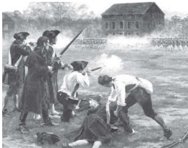
National Army Museum Batalla de Lexington de 1775, inicio de la guerra contra el colonaje inglés, la Primera Revolución Norteamericana.

Corra la voz sobre las luchas sindicales actuales. ¡Ayude a construir el movimiento sindical!