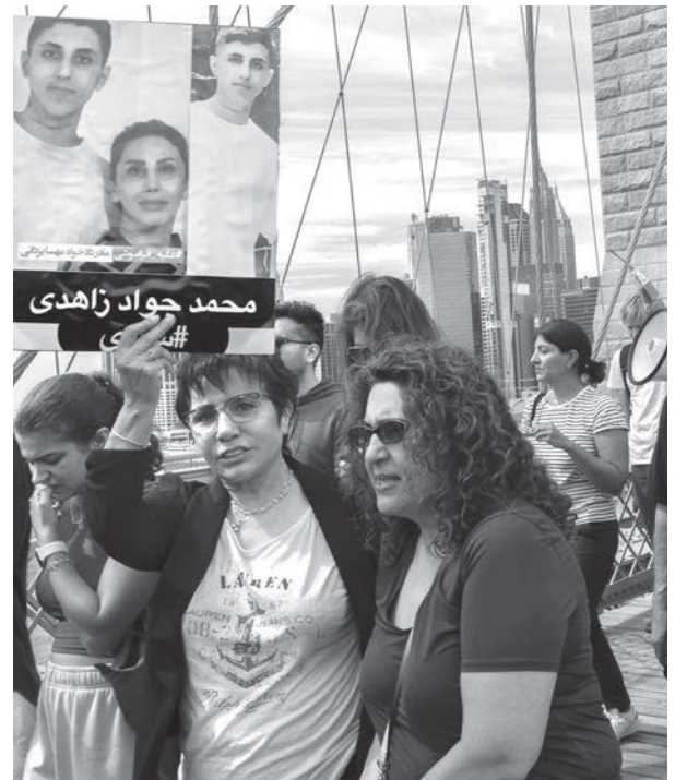
Protestas en Nueva York y alrededor del mundo el 16 de septiembre exigen libertad de presos políticos en Irán.

Las protestas semanales el domingo, lunes y martes por jubilados que