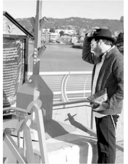
Arriba, restos de menorá destruida en Oakland, California, 12 de diciembre por vándalos. Miembros del Partido Socialista de los Trabajadores se unieron a protesta contra el odio antijudío la noche siguiente (izq.) en la que se prendió la menorá reconstruida.