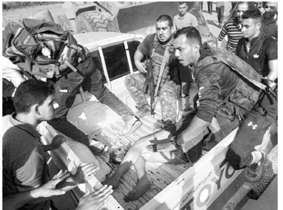
Matones de Hamás en Khan Yunis, Gaza, con mujer secuestrada oct. 7. El grupo terrorista hizo parte de su pogromo antijudío las violaciones, mutilaciones, asesinato y secuestro de mujeres.

Existe una repugnancia generalizada hacia Hamás entre los árabes dentro de Israel, quienes representan casi el 20% de los ciudadanos del país. Al menos 19 árabes beduinos se encontraban entre los asesinados el 7 de octubre. También fueron asesinados varios otros residen-