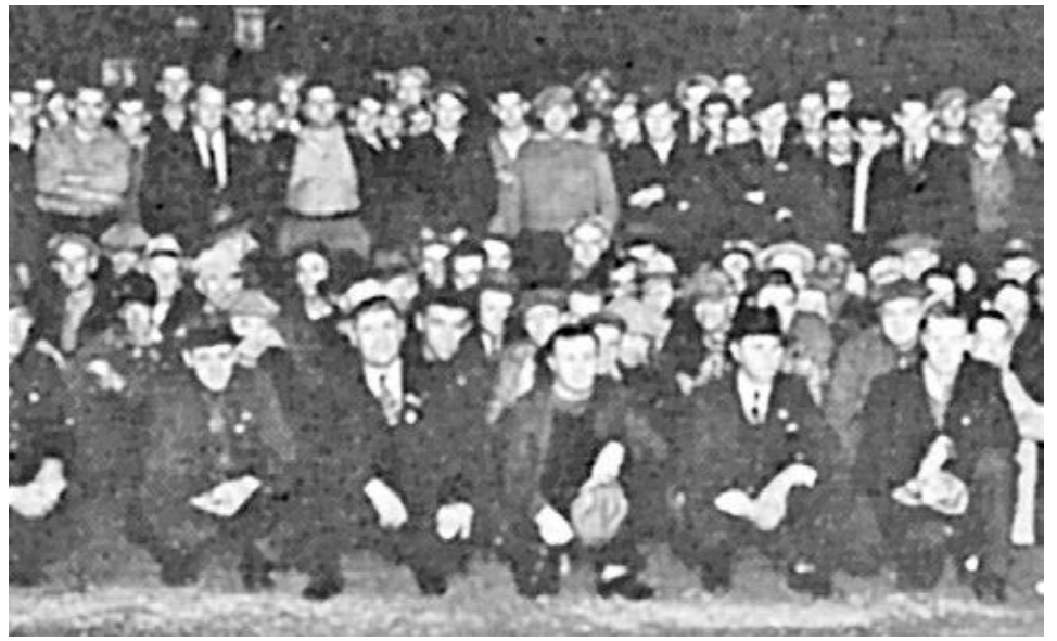
Parte de Guardia Sindical de 600 miembros iniciada por Local 544 de los Teamsters en Minneapolis en 1938 para defender a uniones y repeler a matones antijudíos y antisindicales.

¡Revocar el peligroso asalto de la corte de Colorado contra nuestros derechos!