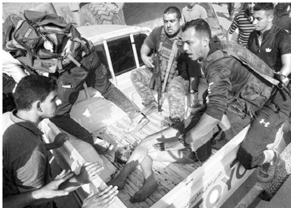
Matones de Hamás en Jan Yunis, Gaza, con mujer secuestrada brutalmente en Israel, 7 de octubre de 2023. El pogromo antijudío del grupo terrorista inició guerra en el Medio Oriente.