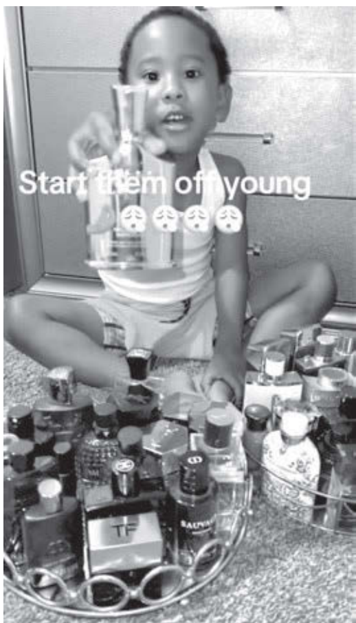
Izquierda: La madre de este niño de cinco años en Nueva Jersey es una “creadora de contenido para redes sociales” que gasta regularmente 300 dólares en colonias “de diseñadores” para su hijo. Dice que el niño está obsesionado con oler bien. Derecha, anuncio de jabón Silka en Filipinas promete “¡la verdadera señal de blanqueamiento!” de la piel en solo siete días!