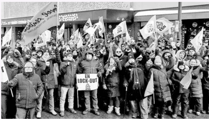
Confederación de Sindicatos Nacionales

MONTREAL — Desde el 20 de noviembre, unos 600 trabajadores de hoteles, afiliados a la Confederación de Sindicatos Nacionales (CSN), se encuentran en un cierre patronal en el Fairmont Queen Elizabeth, el hotel más grande de Quebec. El hotel es propiedad de la Caisse de dépôt placement du Quebec (CDPQ), una de las gestoras de fondos de inversión más grandes de Norteamérica. Arriba, protesta del 20 de febrero.